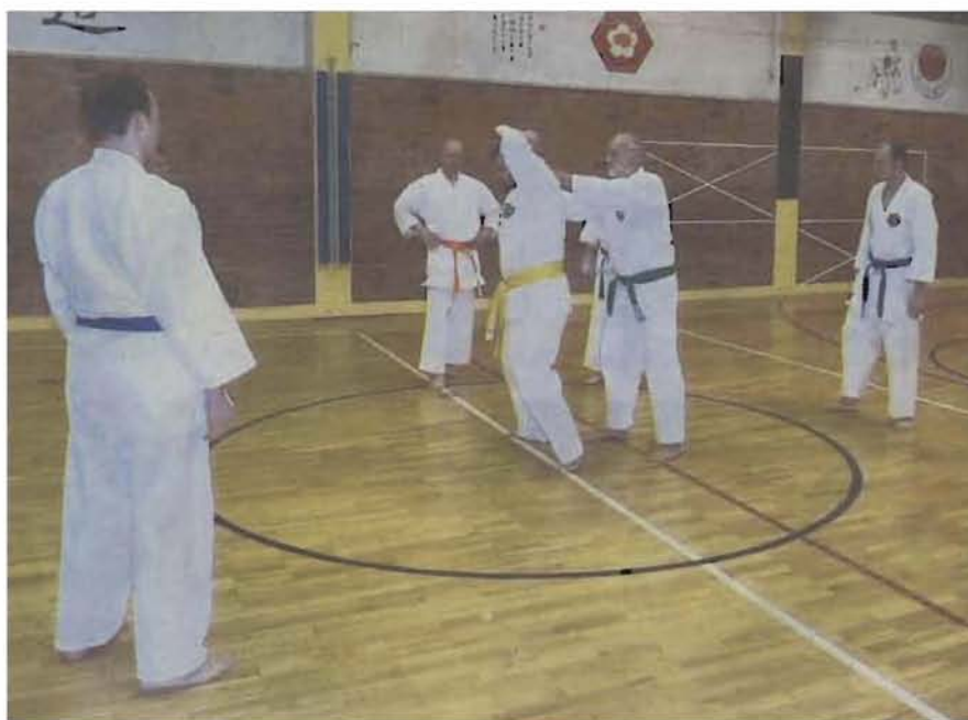
Die Nordhäuser Karateka beim Training: Seit Anfang dieses Jahres gibt es im Do-Kwai eine weitere Trainingsgruppe.

Anwesend ist natürlich auch wieder das Stiloberhaupt Sensei Tamayose (9. DAN) aus Okinawa. Desweiteren werden natürlich auch 2012 wieder die obligatorischen Lehrgänge stattfinden. Los geht es bereits am 25. Februar mit dem Jahreslehrgang für die SaCO-Selbstverteidigung, der offen ist für Jedermann. Weitere Infos gibt es auch im Internet unter www.karate-nordhausen.de .